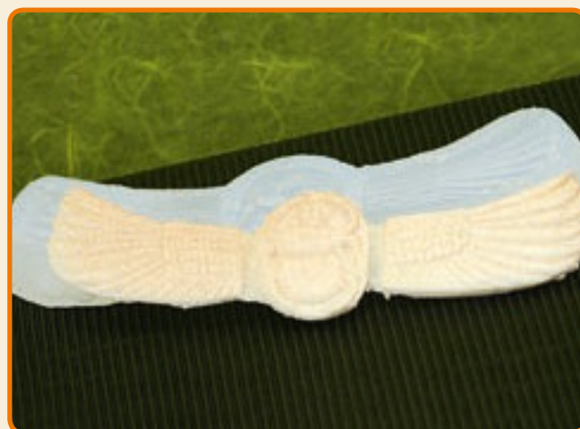
Disegni Egizi 6 DIO KHEPRI