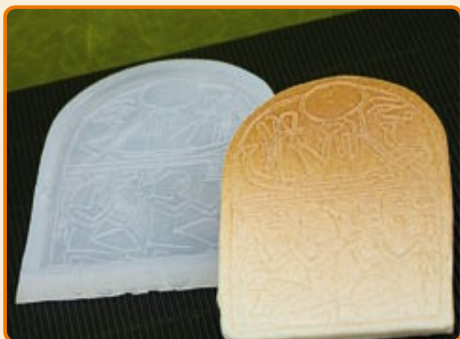
Disegni Egizi 2 Tavola egizia