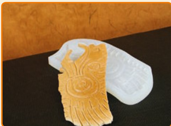
Disegni Maya 03