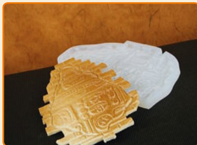
Disegni Maya 04