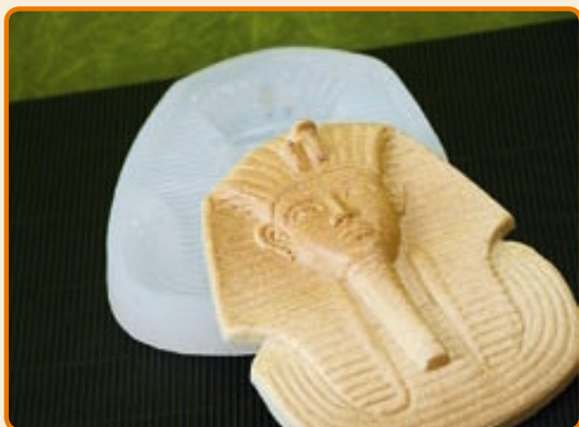
Maschera di TUTAN KHAMON