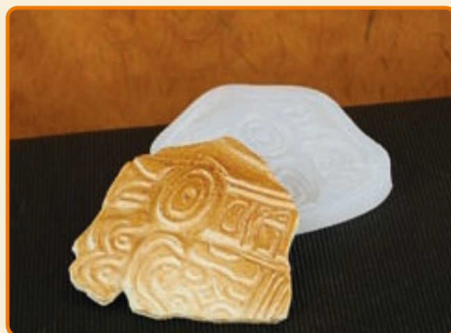
Disegni Maya 12