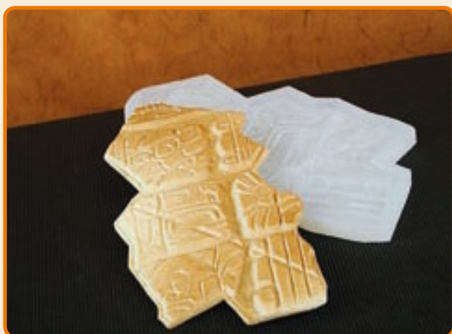
Disegni Maya 05