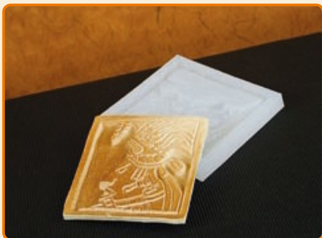
Disegni Maya 01