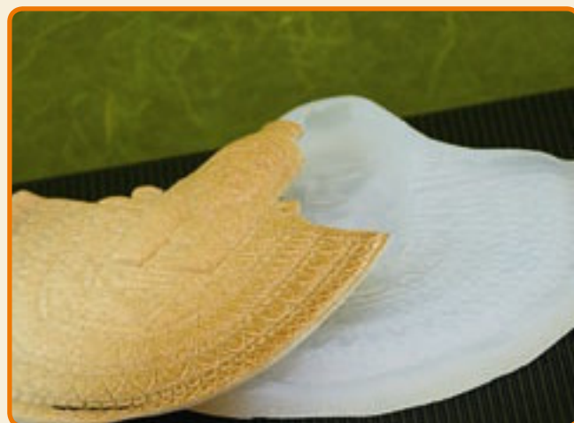
Disegni Egizi 1 Faraone