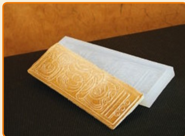
Disegni Maya 02