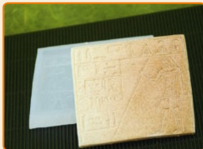
Disegni Egizi 3 Quadro egizio