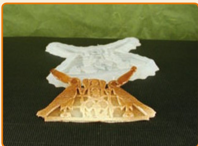
Disegni Egizi 4