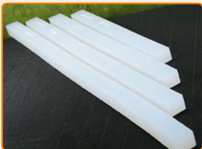
Listelle per basi o per alzate artistiche

Dimensioni dello stampo: b cm 59 x h cm 39 x spessore cm 0,4