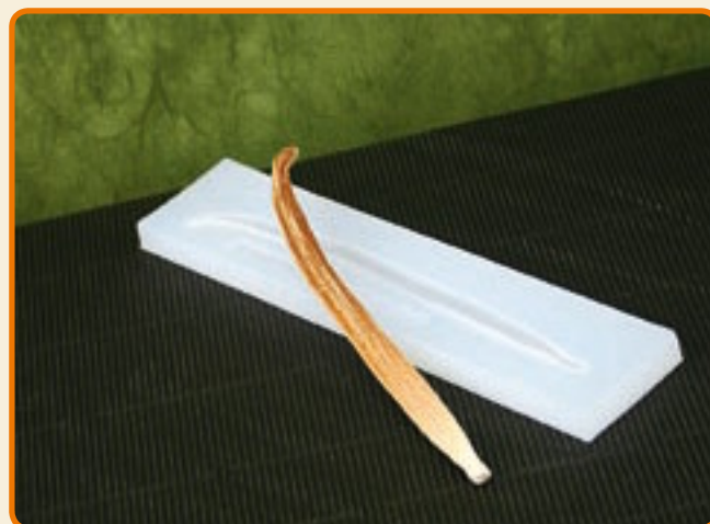
Bacca di Vaniglia Thaiti

Dimensioni soggetto: b cm 20,5 x h cm 0,6 x p cm 0,4 n° soggetti per ogni stampo: 1