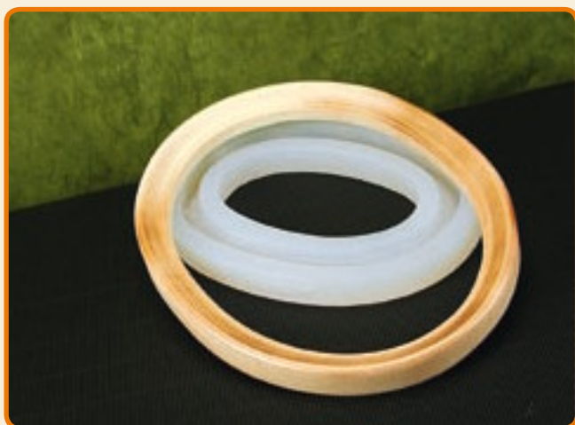
Cornice Ovale Grande