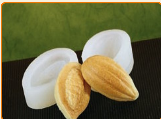
Frutto del cacao chiuso e aperto

Dimensioni del soggetto: b cm 18,5 x h cm 8,5 x p cm 9,5 n° soggetti per ogni stampo: 1