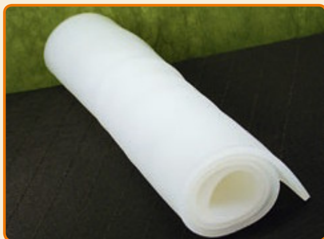
Tappetino Base di lavoro per colare i soggetti