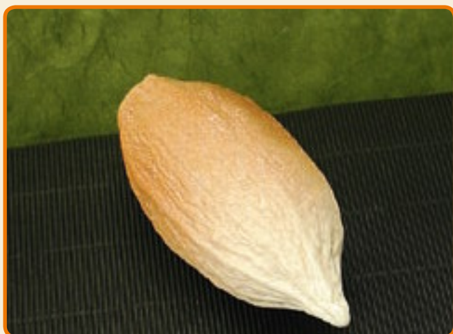
Frutto del cacao medio

Dimensioni soggetto: b cm 16 x h cm 1 x p cm 0,6 n° soggetti per ogni stampo: 1