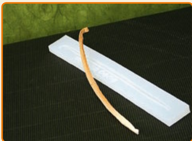
Bacca di Vaniglia Bourbon