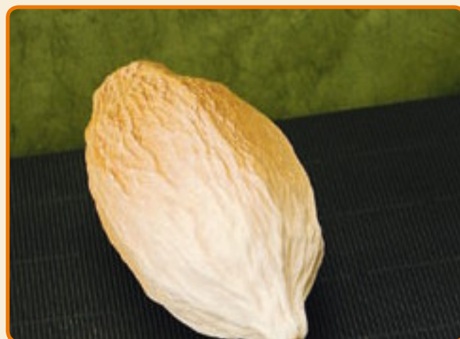
Frutto del cacao grande

Dimensioni del soggetto: b cm 16 x h cm 7 x p cm 6,5 n° soggetti per ogni stampo: 1