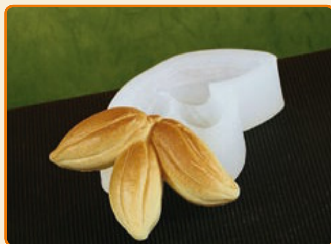
Frutti del cacao 3 cabosse

Dimensioni del soggetto 1: b cm 6,5 x h cm 3,5 x p cm 2 Dimensioni del soggetto 2: b cm 6,3 x h cm 3,5 x p cm 1,7 n° soggetti per ogni stampo: 1